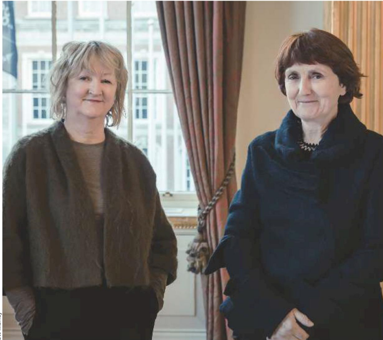
Yvonne Farrell et Shelley McNamara (Grafton), EQUERRE D'ARGENT 2020.